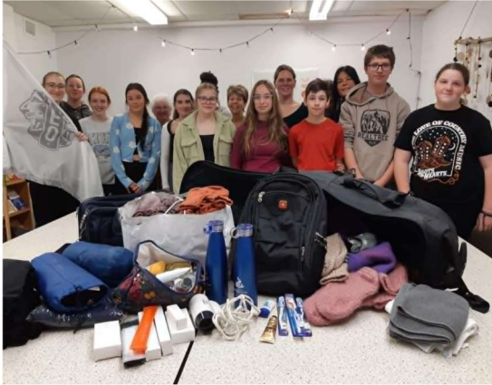
Dons aux travailleurs de rue

Cette soirée sert à sensibiliser les gens du milieu à la réalité des itinérants.